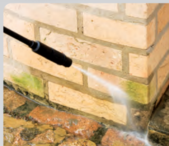
Remoção de lodo