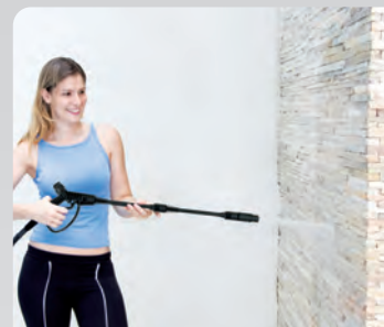
Paredes de pedra